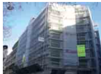
Chantier à Paris (75)

Logotype fourni de l'entreprise sans aucun surcoût :