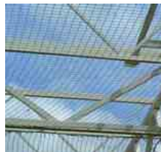
TABLEAU RÉFÉRENCES ET DIMENSIONS