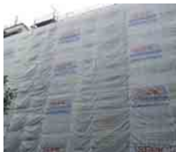
Chantier de la Poste - Rouen (76)

Logotype fourni de l'entreprise sans aucun surcoût :