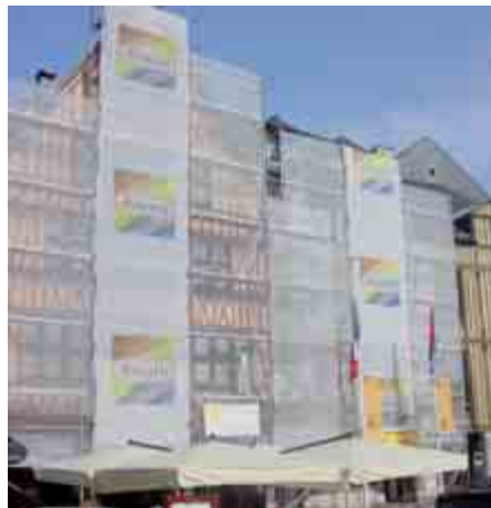
Place du vieux Marché - Rouen (76)

Produit utilisé : Mediatex (filet d'échafaudage 150g/m 2 )