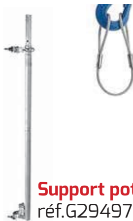
Support potence réf.G29497